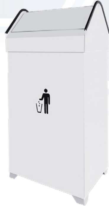
ESQUEMA DE PRODUCTO: